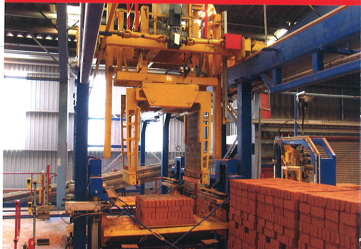
Системы подачи и перемещения