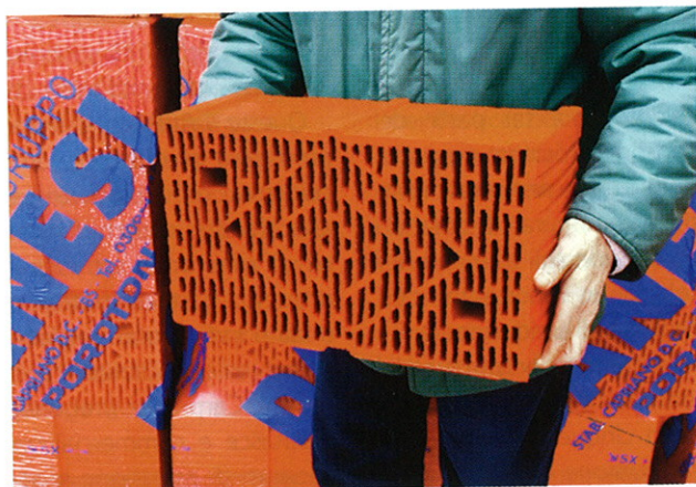
»5 Il nuovo blocco a setti sottili

Questi servizi andranno sicuramente ad aumentare fino a poter ipotizzare in un prossimo futuro il noleggio di particolari attrezzature meccanizzate per facilitare la posa dei blocchi rettificati in cantiere. La distribuzione e la vendita di tutta la produzione del Gruppo Danesi sono gestite da Latercom, società commerciale costituita nel 2000, di cui Fornaci Laterizi Danesi detiene la partecipazione di controllo. ZI